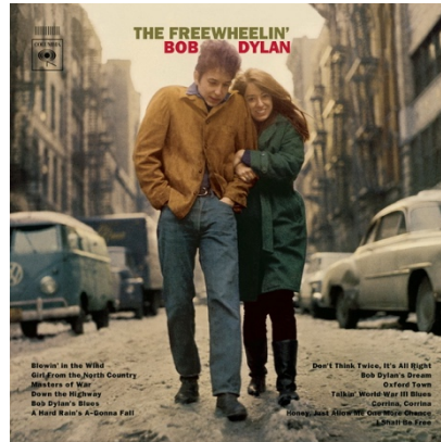
(2) (Cover des Albums)

(1) https://commons.wikimedia.org/wiki/File:Joan_Baez_Bob_Dylan_crop.jpg