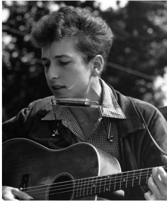
(1) (Bob Dylan)

https://www.youtube.com/watch?v=h2mabTnMHe8 (Lyrics)